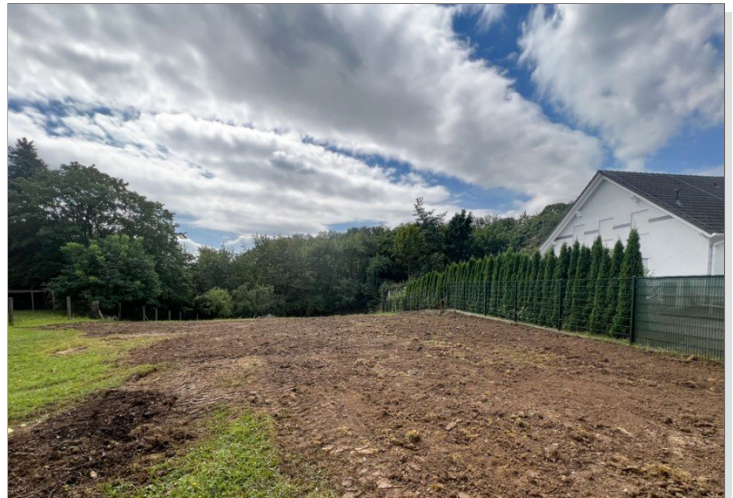
Altbebauung für Sie geräumt