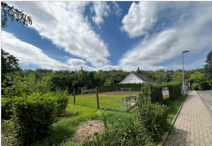
Wohnen im Grünen