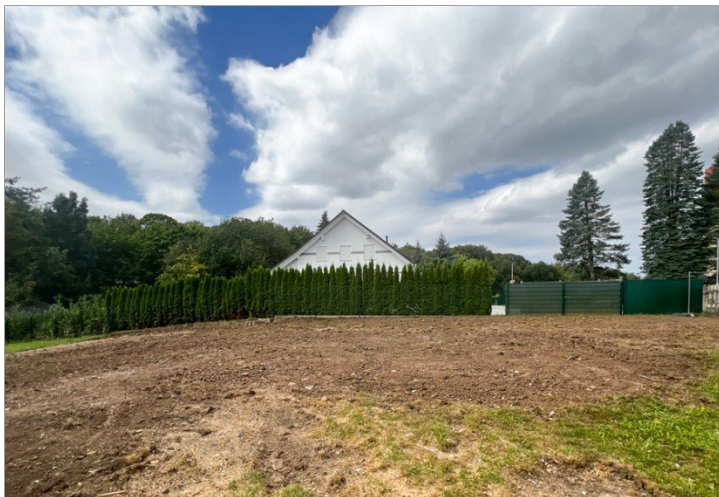
Modernes Doppelhaus zur Linken