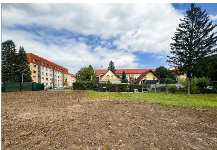
Blick andere Straßenseite