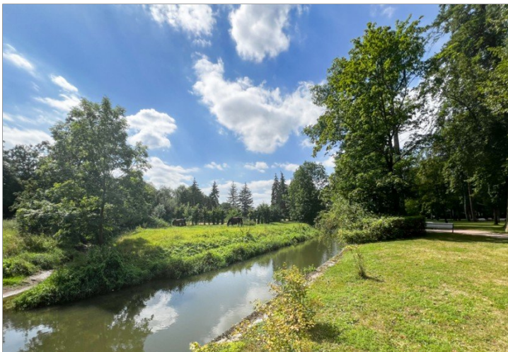
An der Ilm