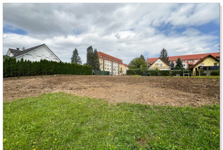
Nachbarbebauung zur Linken