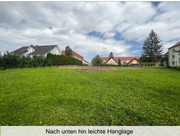
Nach unten hin leichte Hanglage