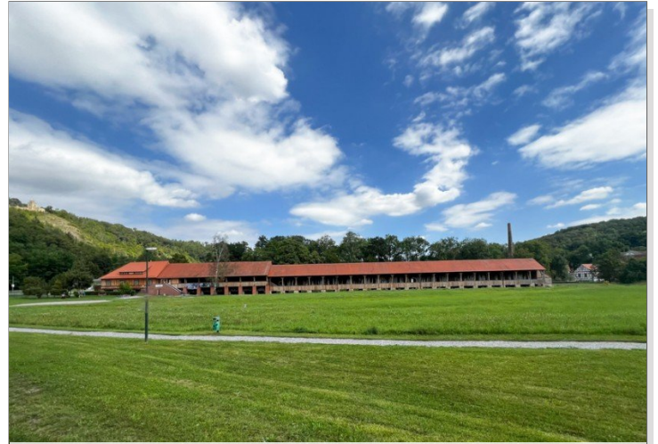
Gradierwerk Bad Sulza_