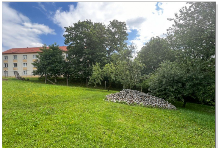
Nachbarbebauung zur Rechten