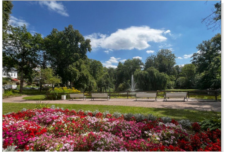
Bad Sulza Kurpark