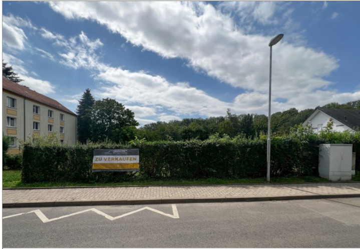
Auf dem Walzel