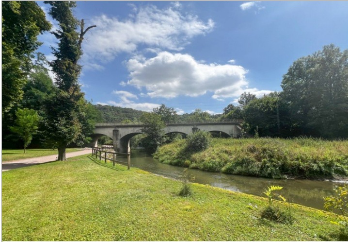
Park an der Ilm