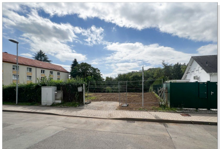
Baugrundstück_Auf dem Walzel