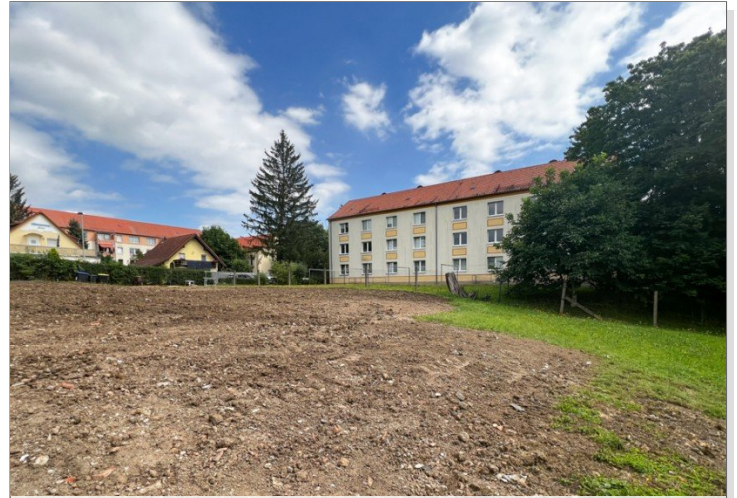
Grundstück im allgemeinen Baugebiet