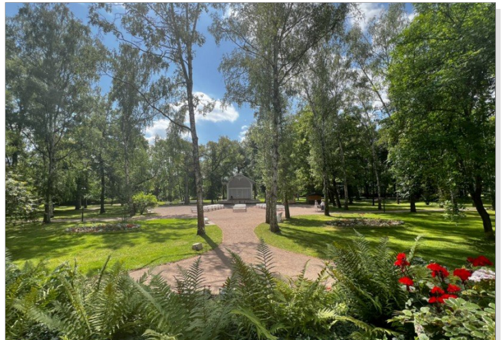
Kurpark Bad Sulza