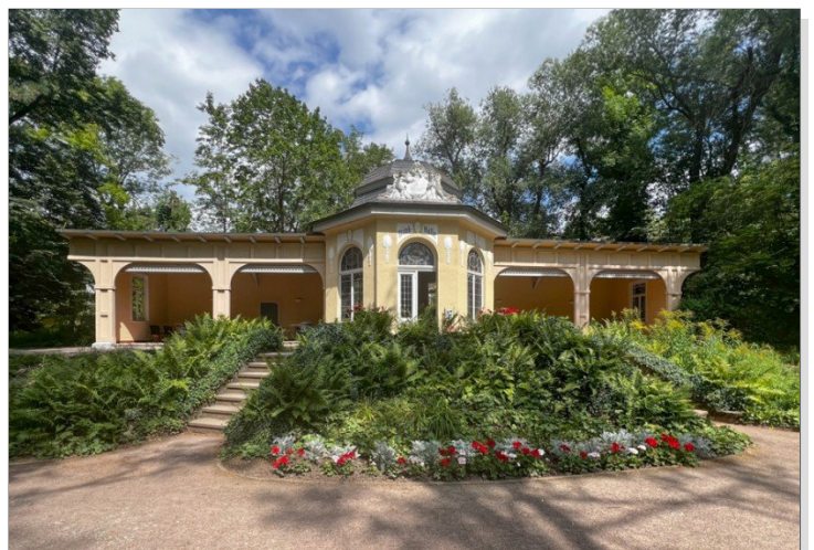
Trinkhalle im Kurpark