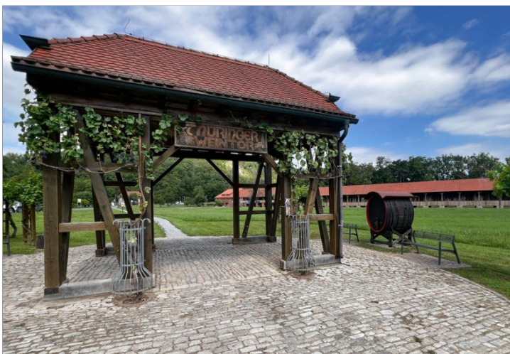
Thüringer Weintor Bad Sulza_