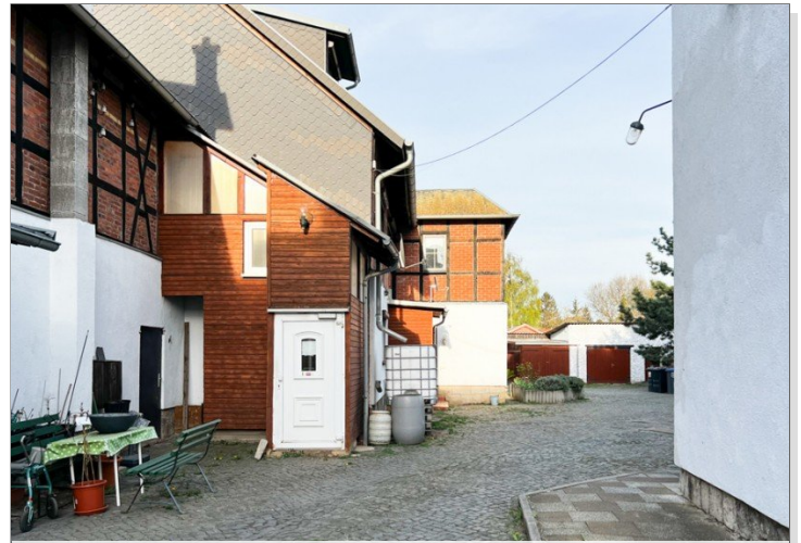
Hofeingang zur Maisonettewohnung