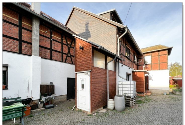
Hauseingang zur Wohnung