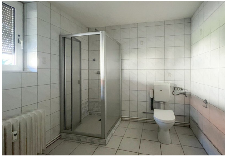
Tageslichtbad mit Dusche