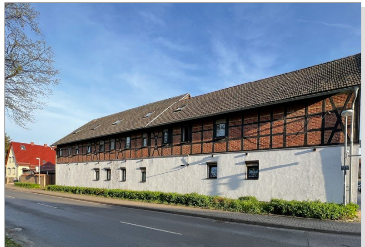
Bezugsbereite Maisonettewohnung in Erfurt_Schelkmann Immobilien