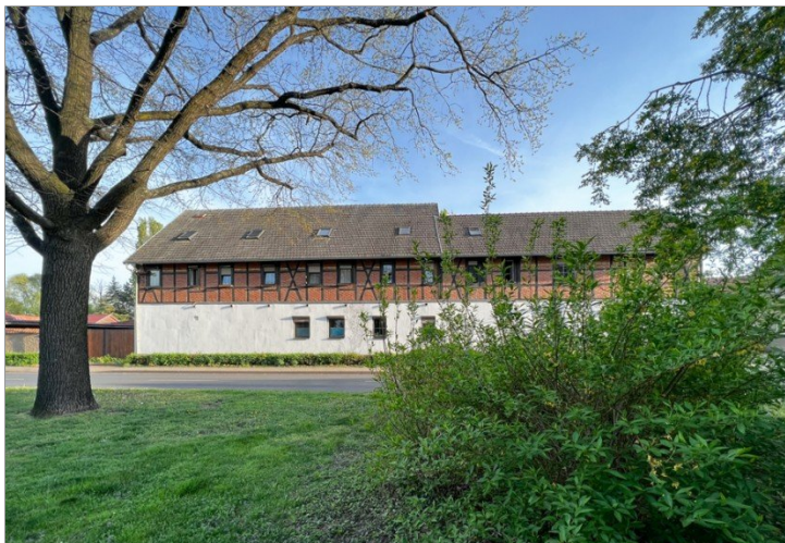
Wohnen in Erfurt Vieselbach