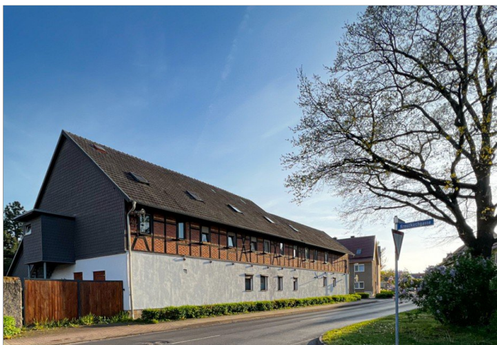
Mietshaus in Erfurt Vieselbach