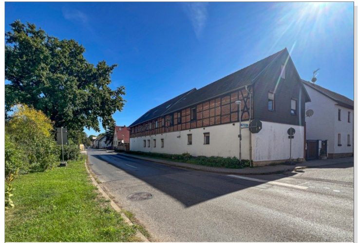
Erdgeschosswohnung zur Miete in Erfurt Vieselbach