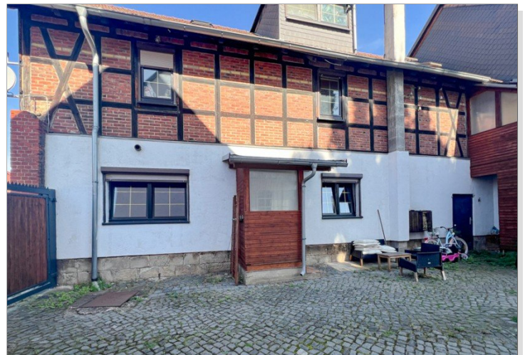
Erdgeschosswohnung mit separatem Eingang