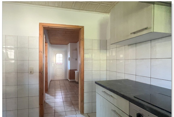
Blick von der Küche in den Flur