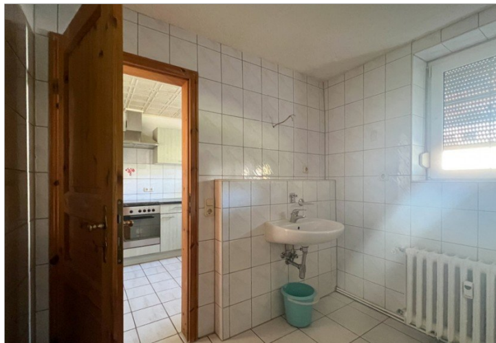
Blick vom Bad in die Küche