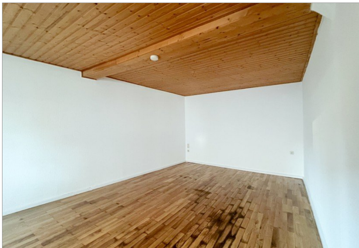
Wohnzimmer mit Holzdecke