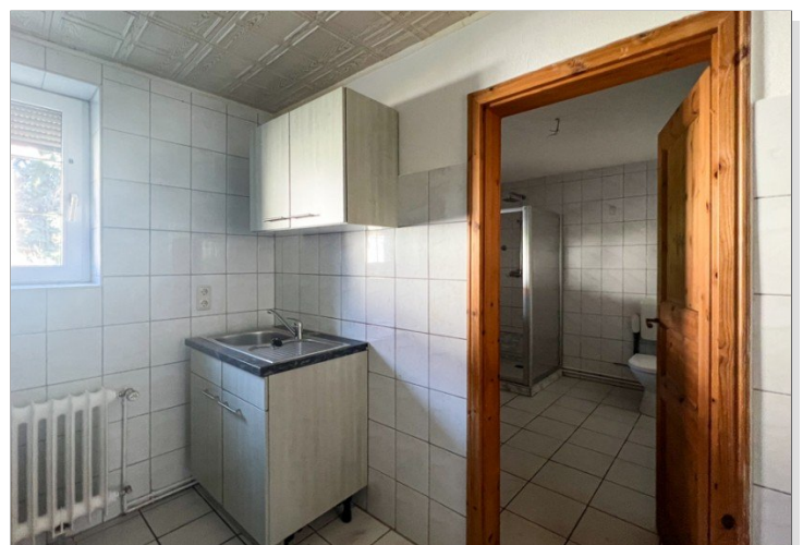
Blick von der Küche ins Bad